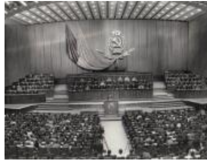
Fotografia #A049, Congresul al VIII-lea al UTC-ului

În acest context, în dorința de a facilita accesul la informații atât istoricilor, cât și celor interesați de perioada comunistă, la data de 1 septembrie 2008, între Arhivele Naționale ale României și Institutul de Investigare a Crimelor Comunismului în România s-a semnat un protocol de colaborare în scopul realizării Fototecii online a comunismului românesc , prima bază de date gratuită accesibilă pe internet cu fotografii din perioada 1945-1989.