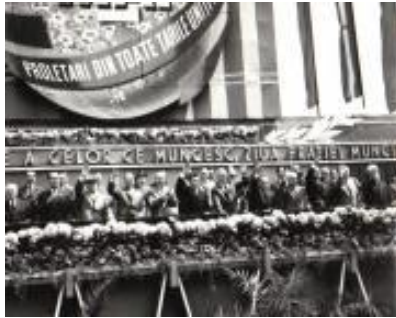
Fotografia #A002, ANIC, fond ISISP, 1 mai 1965

La 19 ani de la Revoluția din 1989, istoria comunismului românesc este încă prea puțin cunoscută, iar accesul istoricilor la documentele vremii a fost supus anumitor restricții.